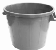
Plastikgefäß max. 75 l/25 kg mit durchbrochenen, umgreifbaren Griffen

Bitte stellen Sie Ihr Grüngut erst am Abfuhrtag bereit.