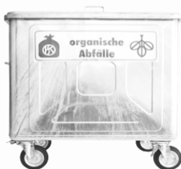
Container 400/600/800 l (Schweizer Norm, Metall oder Kunststoff)