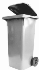
Kleincontainer ab 140/240/360 l grüne Farbe