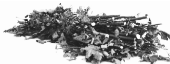
Bündel verschnürt max. 5 cm Astdicke max. 150 cm lang max. 25 kg