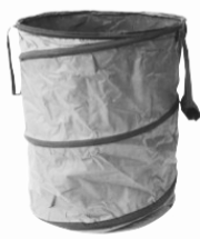
Stabiler Gartensack mit eingebauter Drahtspirale