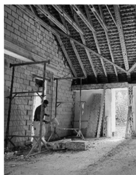
Abdankungsraum / Blick zu den Gräberfeldern