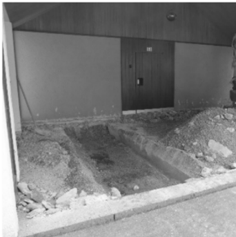
Ausgrabung der Archäologen