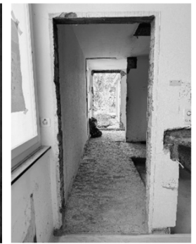
Zugang zum Raum der Stille