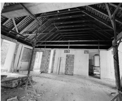
Künftiger Abdankungsraum

Ab dem 12. August 2024 werden der Zimmermann und der Dachdecker am Zug sein, das heisst: Wir sind im Zeitplan und alles läuft wie geplant. Anbei Bilder zum aktuellen Stand der Arbeiten.