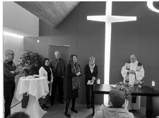
Mit einer feierlichen Zeremonie und der Segnung wurde das Gebäude eingeweiht