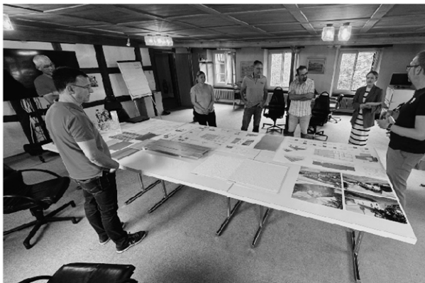
Baukommission, Kirchenpflege und Geistliche bei einem Treffen bezüglich einer optimalen Umsetzung

Im Zeitraum von 24. Juni 2024 bis Ende November 2024 wurde das beinahe 60-jährige Friedhofgebäude des Zweckverbands Friedhof Laufen umfangreich saniert. Anbei einige Bilder, welche einen kleinen Eindruck in die Arbeiten des Umbauprojektes geben.