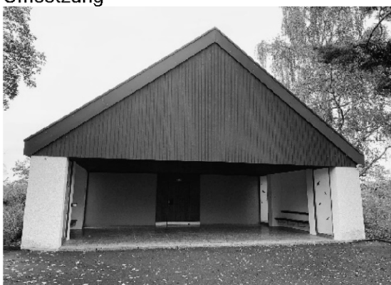
Das Eingangsportal vor der Sanierung