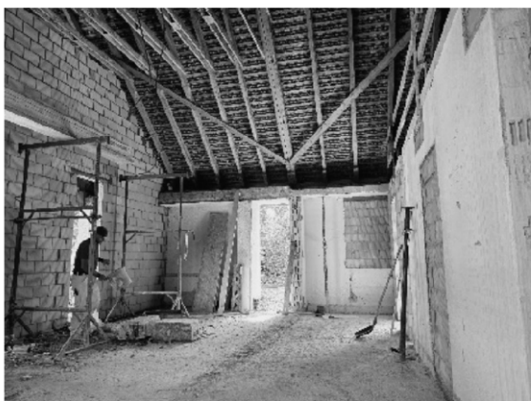
Der gewonnene, grössere Innenraum für künftige Abdankungen