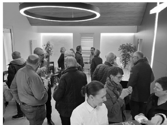
Bei den offiziell geladenen Gästen den Medien und den Einwohnern der drei Zweckgemeinden fand der Umbau ebenfalls grossen Anklang. Bis in den späten Nachmittag wurden rund 150 Besucher empfangen und durch die Räumlichkeiten geführt.