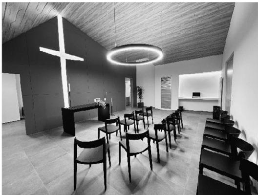
Knapp ein Jahr nach dem Baustart ist alles bereit für die Eröffnung