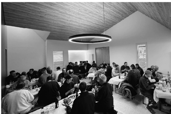
Ein grosses Dankeschön an alle beteiligten Handwerker, für die gute Zusammenarbeit und das daraus resultierende würdevolle Abdankungs- und Aufbahrungsgebäude. Das zahlreiche Erscheinen zum offerierten Mittags-Vesper spricht für sich.