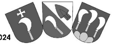
Bild Impressionen der Sanierung und der Einweihung vom 14. Dezember 2024