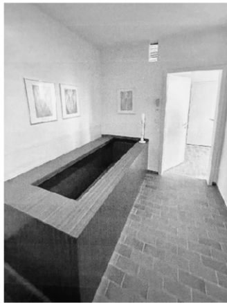
Der ehemalige Aufbahrungsraum mit Katafalk