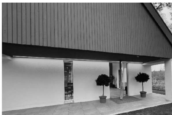
Nachher mit vorverlegter Front um mehr Innenraum zu gewinnen