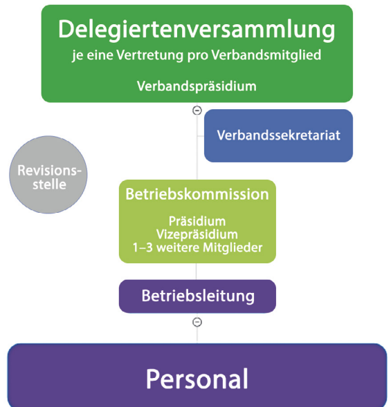
Abbildung 1: Darstellung der neuen Verbandsstrukturen

Oberstes Organ ist wie bereits ausgeführt die Delegiertenversammlung (DV). Sie stellt das Verbandspräsidium, wählt die Mitglieder der Betriebskommission (mind. 3) und bestimmt dessen Präsidium. Die Betriebskommission wählt wiederum die Betriebsleitung, der die betriebliche Verantwortung über die Verbandsanlagen sowie die personelle Füh-